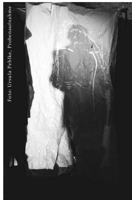
Probenaufnahme

mit unhörbaren Schritten, leise, leise, und nachmittags sitzt sie, stattlich angetan, stolz und gespreizt im Wohnzimmer auf dem Sofa und hat ihre Kaffeeschwestern geladen, das Stillschweigen mit den tauben Ohren, der die Zunge am Gaumen festgewachsen, und die Trübsal, die in geschwätzigster Stimmung nur allstündlich wie Zufallswindhauch verloren seufzt, die und noch andre Stuben-Gespenster, ja sogar das Graulen vom Boden bittet sie zuweilen herab und lässt es sich halb zu Tode wundern über ihren Aufwand, dass es vor Dankbarkeit über die große Ehre ganz überschnappt.