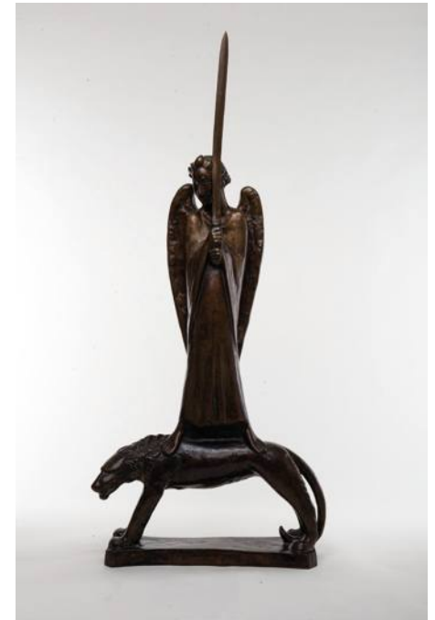
Ernst Barlach • Der Geistkämpfer • 1928 (Guss seit 1938), Bronze ©Ernst Barlach Stiftung Foto: Alexander Klaus