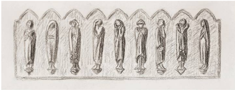
Zeichnung: Ernst Barlach • Fries der Lauschenden