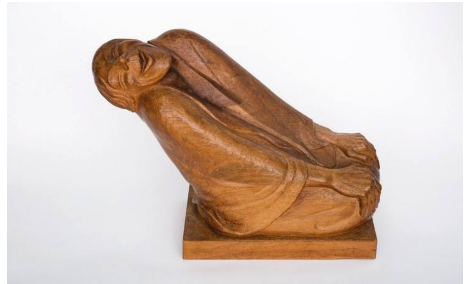
Ernst Barlach • Lachende Alte • 1937, Nussbaum