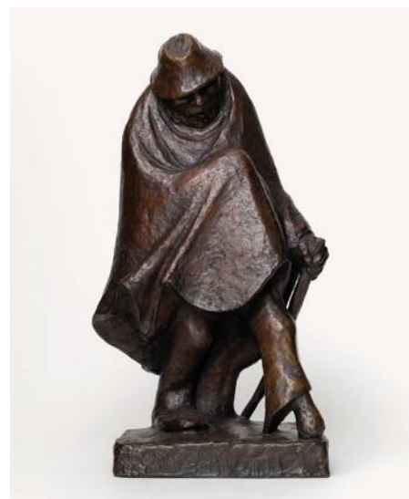
Ernst Barlach • Vergnügtes Einbein • 1934, Bronze, © Ernst Barlach Stiftung

Musik: Walzer Fragmente („Vergnügtes Einbein“)