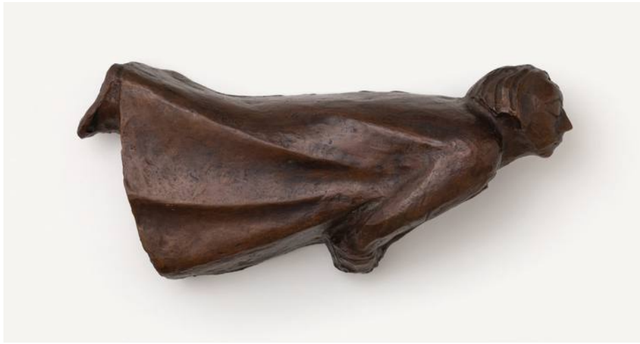
Ernst Barlach • Güstrower Ehrenmal „Der Schwebende“ • Entwurf 1927, Bronze ©Ernst Barlach Stiftung, Foto: Andreas Weiss