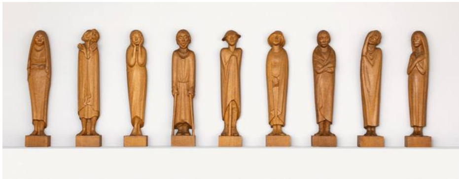
Ernst Barlach • Fries der Lauschenden • 1926, Gips (getönt)