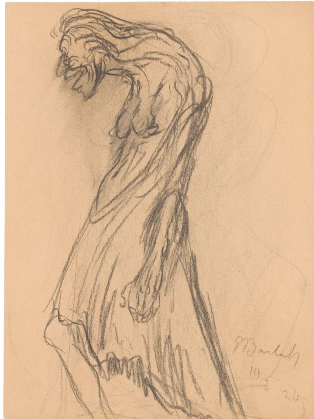
Ernst Barlach • Lachende Furie • 1926, Kohle ©Ernst Barlach Stiftung