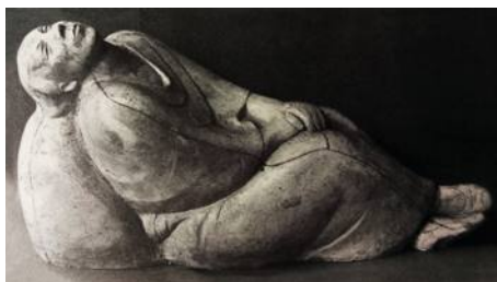
Ernst Barlach • Träumendes Weib • 1912, Holz