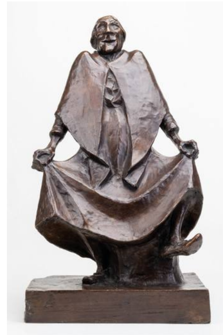
Ernst Barlach • Tanzende Alte • 1920, Bronze ©Ernst Barlach Stiftung, Foto: Alexander Klaus