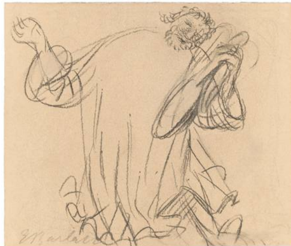
Zeichnung: Ernst Barlach · Tanzender Lautenspieler ©Barlach Stiftung Güstrow

los und so gründeten sie und ihr Ehemann Siegfried Weber das Musiktheater Cammin in dem sie ihre gemeinsamen Ideen und Projekte verwirklichen. Viele Produktionen für Kinder und Erwachsene entstehen in den folgenden Jahren in enger Verbindung mit Theater und Musik.