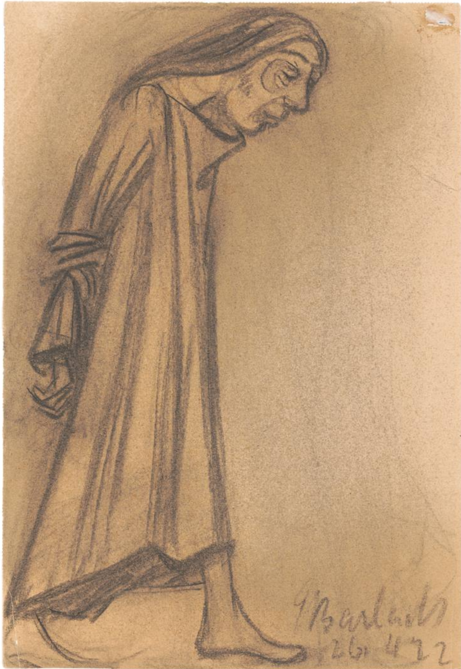
Ernst Barlach • Gang zum Scheiterhaufen • 1922, Kohle ©Ernst Barlach Stiftung